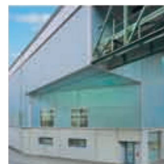
фасадные покрытия из стекловолокна