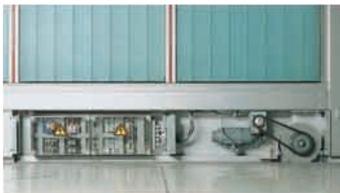
На воротах с электрическим приводом система управления и привод расположены в кармаше.