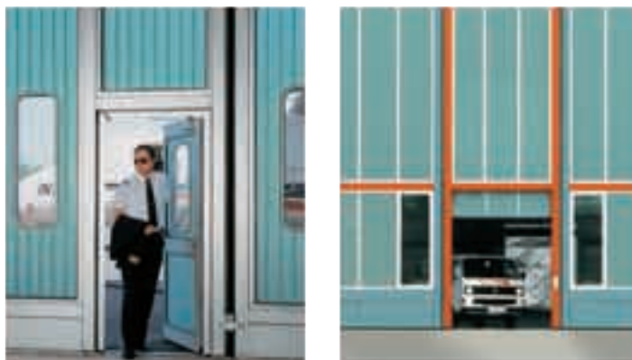
Двери или ворота без порогов обеспечивают быстрый проход.

Aquila / ASTRIUM / BASF AG / Brose Coburg (D) / Burri-Fichter KG / Caterpillar / DaimlerChrysler Stuttgart (D) / Dassault Aviation / Diamond Aircraft GmbH / OLE Baden-Airpark / Dornier-Fairchild GmbH / Douanes Le Havre (F) / EADS Airbus Deutschland / EADS France Toulouse (F) / EMT Istanbul (TR) / Eurocopter Deutschland GmbH / FVG Lübeck (D) / General Aviation / General Electrics / HeliTransair / Hover Dormagen (D) / I.A.I Ben Ghurion Airport / IMA Manching (D) / Jet Aviation / Lange Flugzeugbau / LEGO Systems / Pfalz-Flugzeugwerke GmbH / Pilatuswerke / Piper AG / REGA-Center Zurich (CH) / SWISS / Viessmann / Volkswagen AG Braunschweig (D) / White Eagle Aviation / Wiking Helikopter Service GmbH / Zeppelin Luftschifftechnik / ZIMEX Aviation