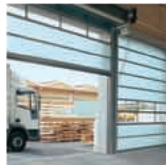
Подъемные ворота из стекловолокна

Кроме того, мы подготовили для своих клиентов специальные предложения по сервису и техобслуживанию. Обращайтесь к нам за ними!