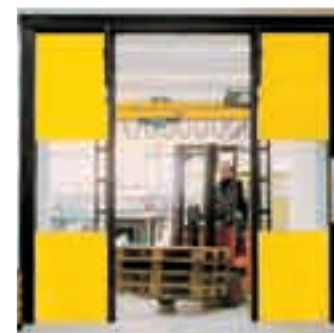
быстро раскрывающиеся ворота