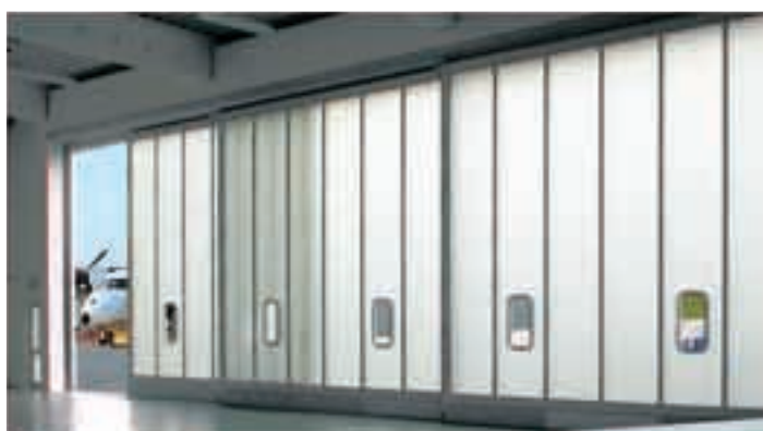
Различные цвета стекловолокна на выбор (изумруд, сапфир и бриллиант) делают возможным индивидуальное оформление ворот и фасада.