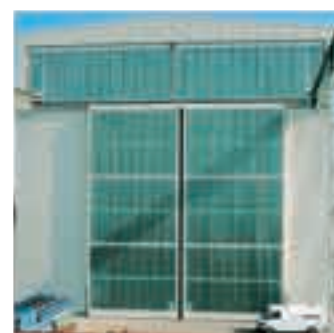
верхние ворота для кран-балки